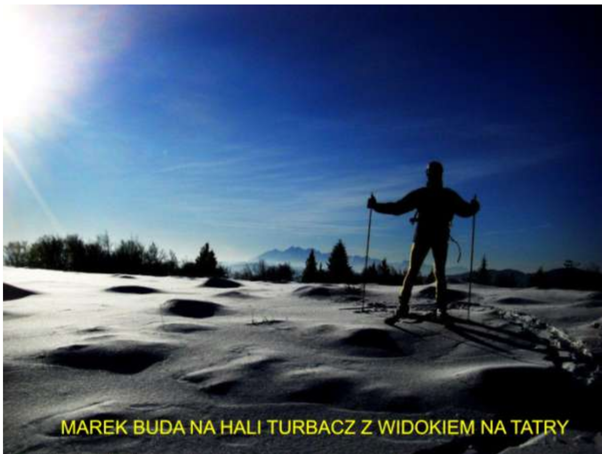
Ryc. 9 Na szlaku narciarskim Runek – Hala Pisana 01.01.13

Kolejną zimę zamierzamy powitać w grudniu w Alpach Włoskich – Dolomitach na tzw. „Pierwszym Śniegu”.