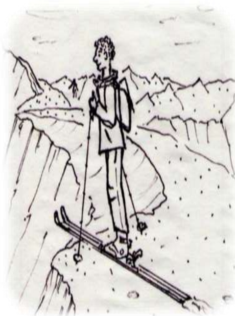
Rys. Piotr Piwowar

Kolejną zimę zamierzamy powitać w grudniu w Alpach Włoskich – Dolomitach na tzw. „Pierwszym Śniegu”.