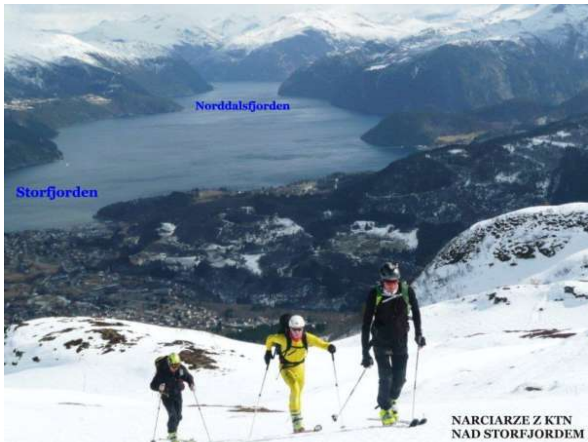
Ryc. 2 Norwegia – Alpy Sunmorskie w Górach Skandynawskich 22.04.13

również zorganizować wyprawę do Rumuni w Karpaty Marmaroskie, gdzie zdobyliśmy ich dwa najwyższe wierzchołki: Farcheń i Michajłek. W minionym sezonie przeprowadziliśmy także imprezy bardziej masowe, czyli Rajdy Szlakami Narciarskimi Pasma Radziejowej i Jaworzyny Krynickiej oraz bardzo ciekawe imprezy ekstremalne tj., przejście 7 Dolin Gorczańskich i Korony Beskidu Niskiego. Oficjalne sezon zakończyliśmy w norweskiej części Gór Skandynawskich zwanej Alpami Sunmorskimi, a część naszej komisji w Dolomitach Brenta.