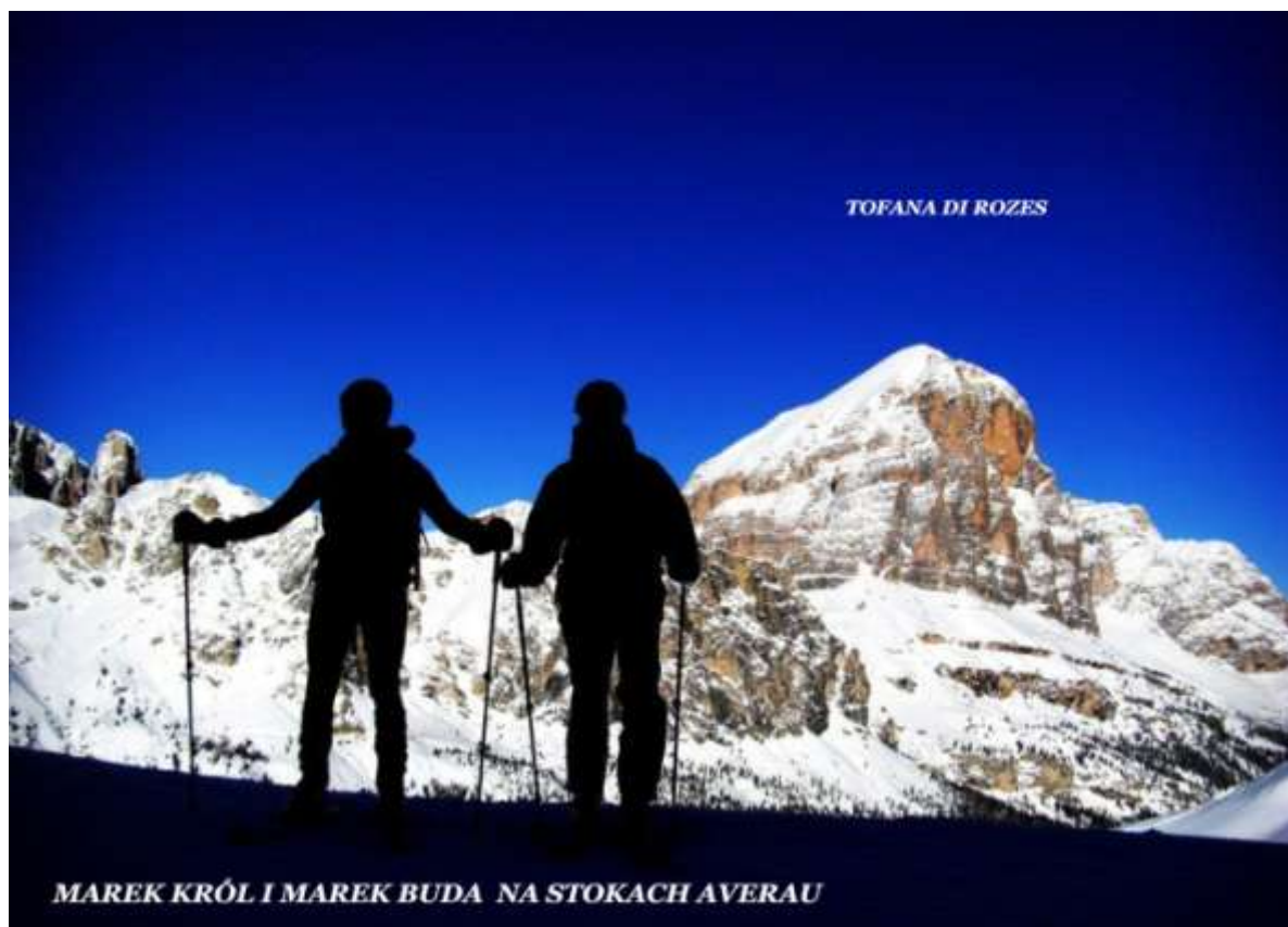
yc. 6 Alpy Włoskie - Dolomity 21.01.13