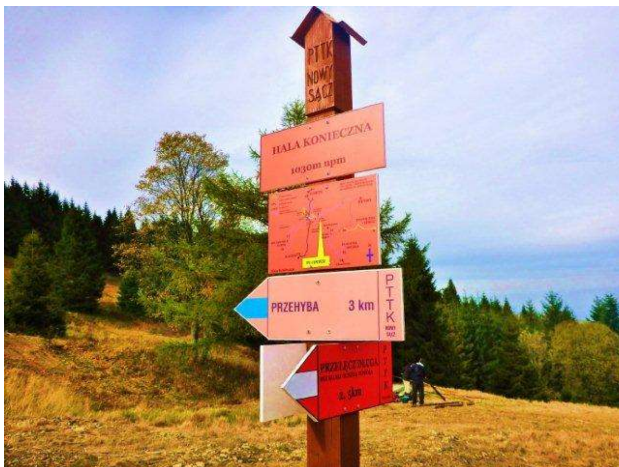
Ryc. 1. Słup ozdobny z kompletem drogowskazów na Hali Koniecznej 09.10.13

Komisja Turystyki Narciarskiej PTTK Oddział „Beskid” w Nowym Sączu w sezonie zimowym 2012/2013 utrzymywała 152km turystycznych szlaków narciarskich w Beskidzie Sądeckim i 18km szlaków w Gorcach. Dzięki pozyskanym dotacjom udało się wykonać 100 sztuk tyczek i 10 sztuk drogowskazów, które zostały zamontowane w miejsce brakujących, lub zniszczonych. Dużą część robót na szlakach (zwłaszcza wycinkę krzewów, konarów, poszerzanie tras) znakarze naszej komisji wykonywali społecznie. Brak odpowiedniej ilości drogowskazów powoduje miejscowe luki w oznakowaniu szlaków narciarskich. Staramy się by standardem w oznakowaniu szlaków narciarskich na omawianym terenie były słupy ozdobne (umieszczane w punktach istotnych dla szlaków) z kompletem drogowskazów, tabliczek topograficznych i schematem przebiegu szlaków.