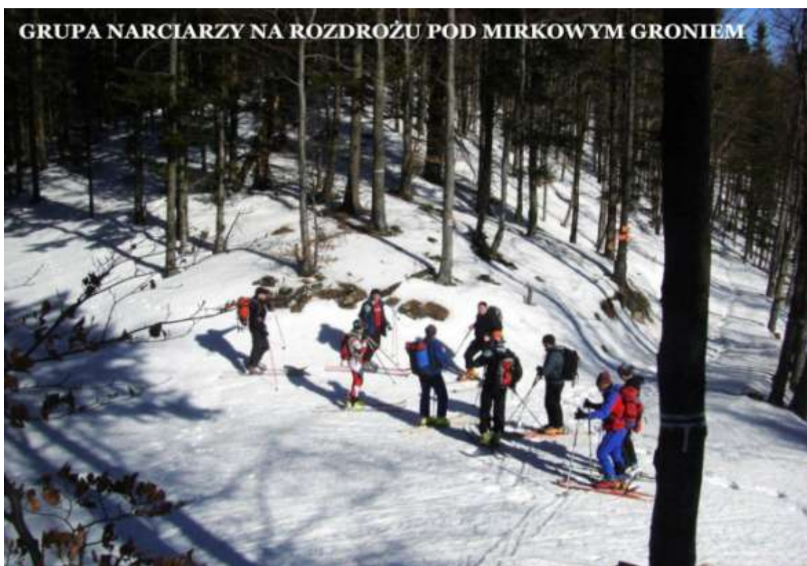
GRUPA NARCIARZY NA ROZDROŻU POD MIRKOWYM GRONIEM

. 7 Na trasie 7 Dolin Gorczańskich 16.02.13